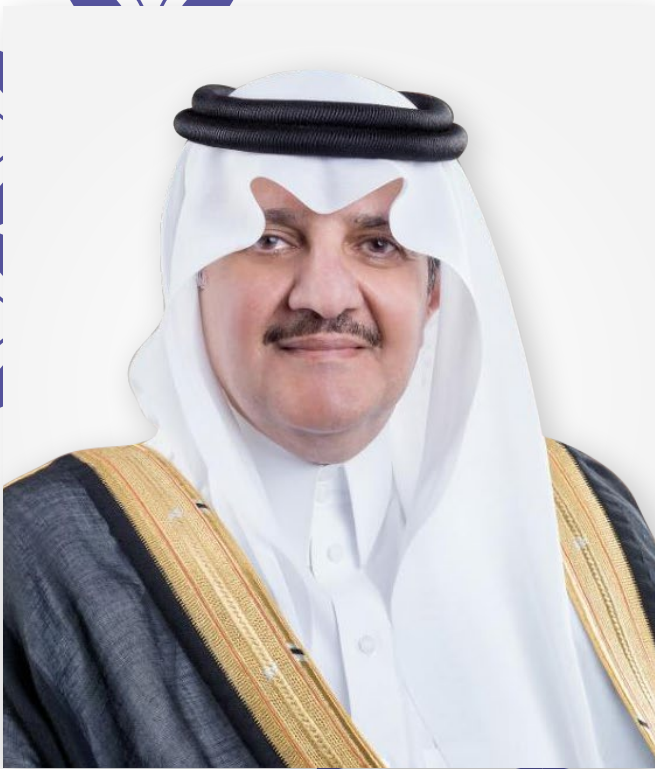
كلمة صاحب السمو الملكي الأمير سعود بن نايف بن عبد العزيز آل سعود أمير المنطقة الشرقية خلال تدشين مبادرة "الشرقية تبدع"

"هذه المنطقة محظوظة بما جباها الله عز وجل من ثروات والبلد ككل محظوظ بأبنائه، فيكفينا شرقاً محاولات أبنائنا للعمل من أجل الوصول للعالمية"