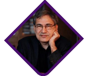
أورهان باموق جائزة نوبل للآداب 2006