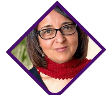
إيمان مرسال كاتبة وشاعرة مصرية