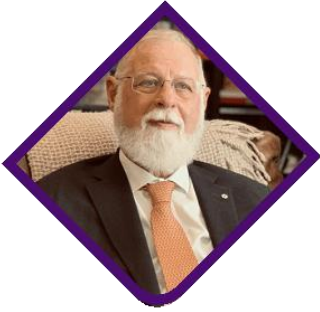
ألبرتو مانغويل كاتب أرجنتيني