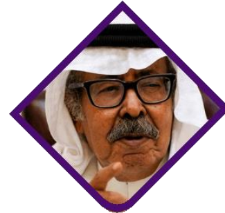
سعيد السريحي كاتب وناقد سعودي