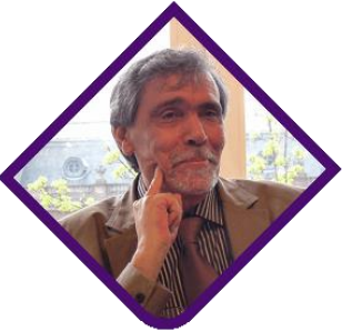
عبدالفتاح كيليطو كاتب وناقد مغربي