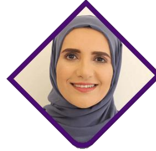
جوخة الحارثي جائزة المان بوكر الدولية 2019