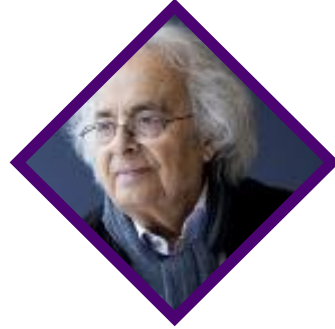
أدونيس شاعر ومفكر سوري